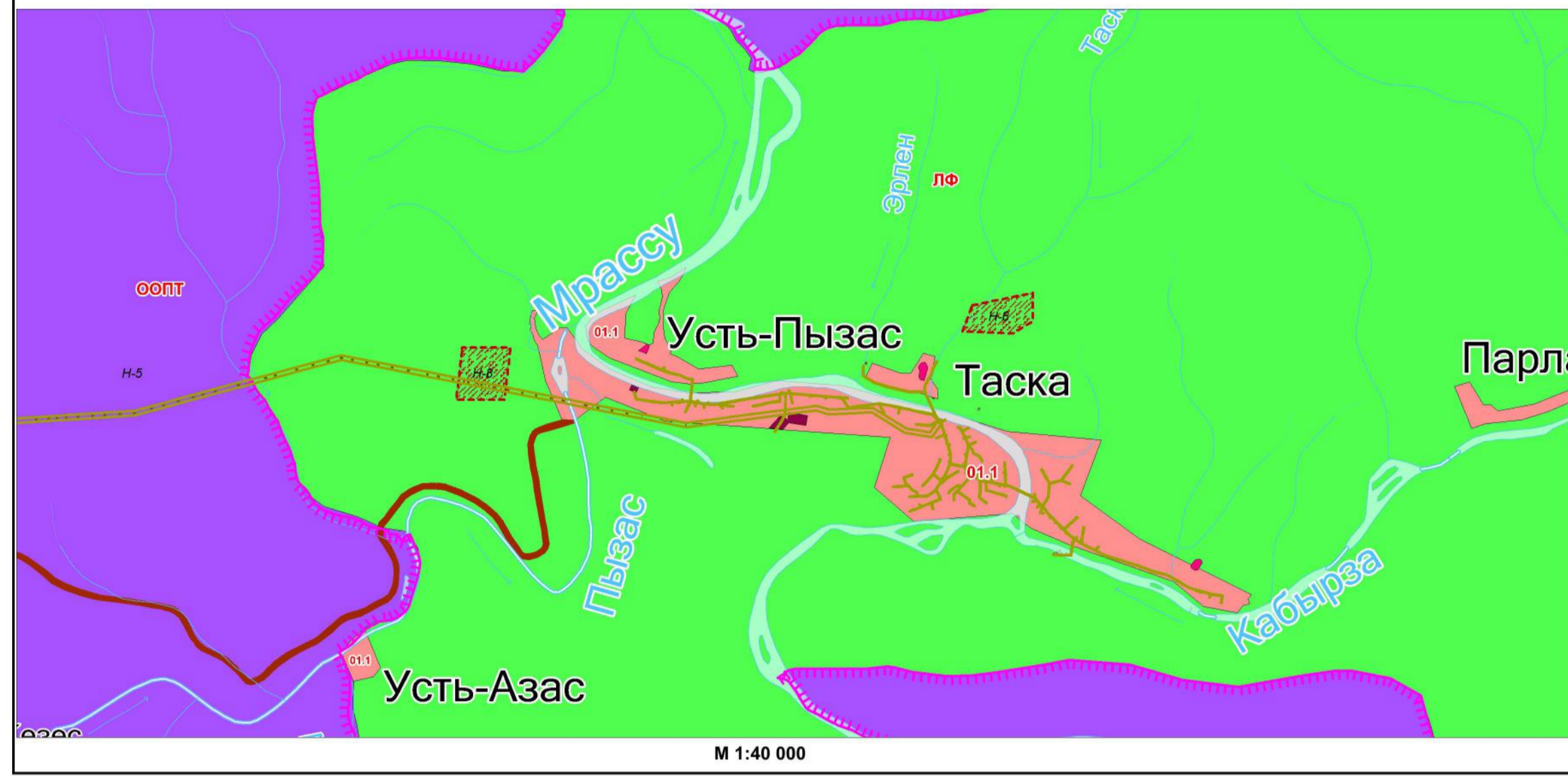
Выноска 1. Фрагмент карты градостроительного зонирования муниципального образования "Усть-Кабырзинское сельское поселение". Населенные пункты Усть-Кабырза, Усть-Пызас, Таска